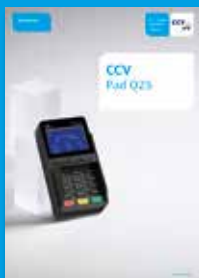
Dokumentation „Erste Schritte“