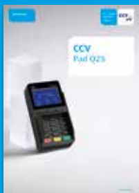
Document "First steps"