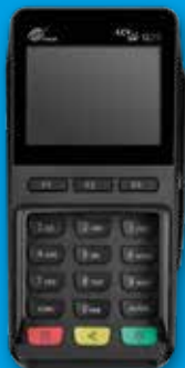
Terminal CCV Pad Q25