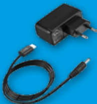
Netzadapter mit Kabel USB-A auf Hohlstecker